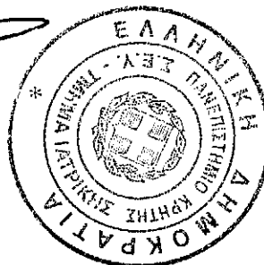
Τσότης Δημήτριος Καθηγητής πρώτης βαθμίδας